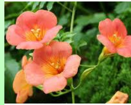
ラベンダー 7月の花 ノウゼンカズラ